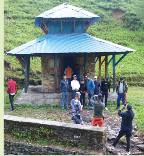
जलजला क्षेत्रमा अवस्थित बजुबराह मन्दिरको दृश्य

गरेपछि मनोकांक्षा पुरा हुने र सन्तानलाभ हुने विश्वास रहदै आएको छ। जेष्ठ पूर्णिमाको वराह मेलामा हजारौंको संख्यामा तिर्थालुहरू आउने गर्दछन्। किंवदन्ती अनुसार यहाँको भामागुफा बाट १२ भाइ वराह र २२ बहिनी बज्यू वराह उत्पत्ति भई नेपालका विभिन्न स्थानमा फैलिएका थिए। त्यसकारण भामा गुफालाई वराहाको उत्पत्तिस्थल हो भनेर स्थानीयहरूले मान्ने गरेका छन्। यस रमणीय क्षेत्रको प्राकृतिक सुन्दरता भण्डै अरु क्षेत्रहरू भन्दा अतुलनिय र बेग्लै प्रकारको छ।