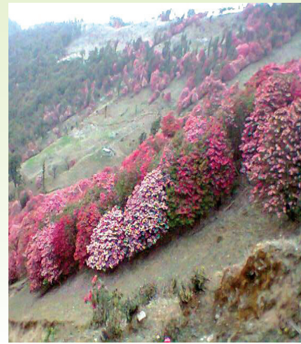
बैशाख जेठमा देखिने गुराँस सहितको दृश्य

यस क्षेत्रमा करिब १४ प्रजातिका गुराँस फुल्दछन्। ३,००० मिटर भन्दा उच्च स्थानका लेकहरूमा जेठ र आषाढ सम्म फुलिरहने यी हिमाली गुराँसहरूलाई स्थानीयहरूले चिमाली समेत भन्दछन्। यहाँ घोरल, थार, रतुवा, हरिण, बँदेल, चितुवा, भालु र दुर्लभ रेड पाण्डा लगायत जंगली जनावरहरू पाइन्छन्। जलजला क्षेत्र डाँफे, मुनाल, कालिज सहित सयौं प्रकारका चराचुरुङ्गीहरूको बासस्थान पनि हो। यहाँ पाइने मुख्य वनस्पतिहरूमा धुपि सल्ला, लौठ सल्ला, खर्सु, बाँझ, सरी, लालीगुरास, उत्तिस, अत्तिस, अञ्जेर, चिलाउने, काफल, ओखर, चुत्रो, टुनी, कटुस, लाँकुरी, खोटे सल्ला आदि पर्दछन्। उच्च पहाडी क्षेत्रमा पाइने धेरै प्रकारका घाँसे प्रजातीका फूलहरू फुल्दा श्रावण भदौ महिनामा यहाँका बुकीक्षेत्रहरू अत्यन्तै मनमोहक देखिन्छन्। जलजला क्षेत्रमा जमिनबाट लगातार रूपमा रसाइरहने पानीका कारण यहाँको भु-भाग सिमसारमय छ जुन राप्ति नदीको उद्गम स्थल हो। जडिबुटीहरूको हकमा यस क्षेत्रमा सतुवा, पदमचाल, पाँचऔले, चिराइतो, सुनगाभा, सुगन्धवाल, सुनाखरी, समायो, चुत्रो, गरेली फूल, दालचिनी, तेजपात, बोजो, कचुर, पुदिना, टिमुर, सिल्टिमुर, धम्पे, सिङ्गली मिङ्गली, रुकन, ढुंगेफूल, विषमा, हडिजोर, बकिन्नो, काकरसिंगे, सिउँडी आदि पाइन्छन्।