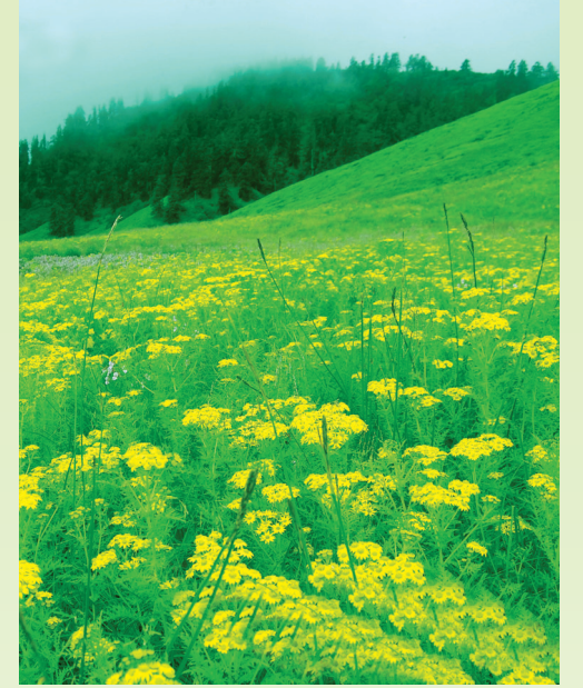
साउनभदौमा जलजलामा फुल्ने घाँसेफुल

◆ लिवाङ-जंकोट-जलजला: सदरमुकाम लिवाङबाट माडीचौर, नम्लि, भिरखोला हुँदै जंकोटसम्म गाडीमा (भाडामा पनि उपलब्ध हुन्छ) २ घण्टामा पुगिन्छ।