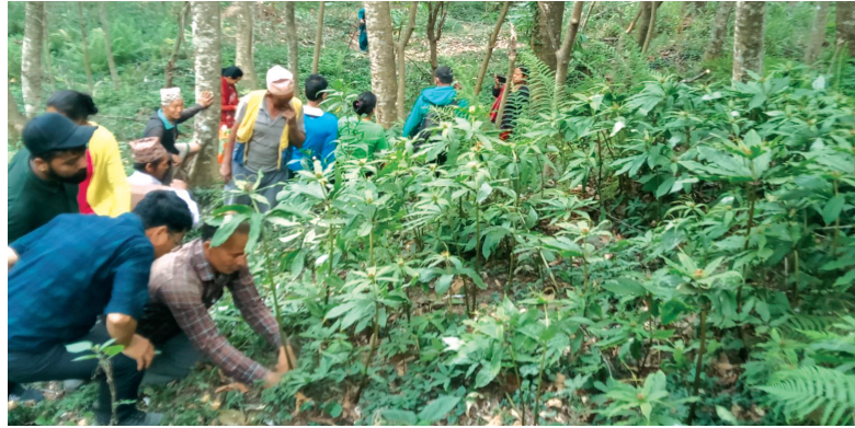
परिवर्तन ४ रोल्पाको भिउजी पाखा क.व. का उपभोक्ताहरू संग सतुवा स्व-स्थानीय संरक्षण अवलोकन

डिभिजन वन कार्यालय रोल्पामा आ.व. २०७८/७९ बाट स्थानीय स्तरमा उपलब्धताको आधारमा थवाड गाउँपालिकाको उवा र रोल्पा नगरपालिका-१०, पेवा बल्लेदह सामुदायिक वन उपभोक्ता समूहका सतुवा खेतीतर्फ अग्रसर किसानहरू र परिवर्तन गाउँपालिकाको पाछावाड स्थित भिउजीपाखा कबुलियती वनका उपभोक्ताहरूको भिन्न-भिन्न सञ्जाल बनाई विरुवा उत्पादन र खेती बिस्तारका लागि आवश्यक परामर्श, तालिम र अनुदान दिई स्व-स्थानीय संरक्षण विधि अपनाई लोप हुन नदिने र भविष्यमा यसको दिगो व्यवस्थापन गर्न सकिने गरी अवश्यक पहल शुरु गरेको छ। आगामी आर्थिक वर्षहरूमा पनि यस अभियानलाई निरन्तरता दिने हिसाबले वन उपभोक्ता समूहहरूसँग छलफल गर्ने, संरक्षण र खेती बिस्तार तर्फ आवश्यक योजना तयारीका साथ डिभिजन वन कार्यालय अगाडि बढेको छ। परस्थानीय संरक्षण तर्फ डिभिजन वन कार्यालय अन्तर्गतको मेवाड नर्सरीमा ५०० वटा गानो सहितका विरुवा रोपण गरिएको छ। रोपण गरिएका विरुवाहरूको उचित व्यवस्थापन गरी आगामी वर्षदेखि निरन्तर सतुवाको विउ उत्पादन गर्ने र सो बाट विरुवा उत्पादन गर सामुदायिक वन, कबुलियती वन र सतुवा खेती गर्न चाहने किसानहरूलाई सतुवाको विरुवा निःशुल्क वितरण गर्ने लक्ष लिइएको छ।