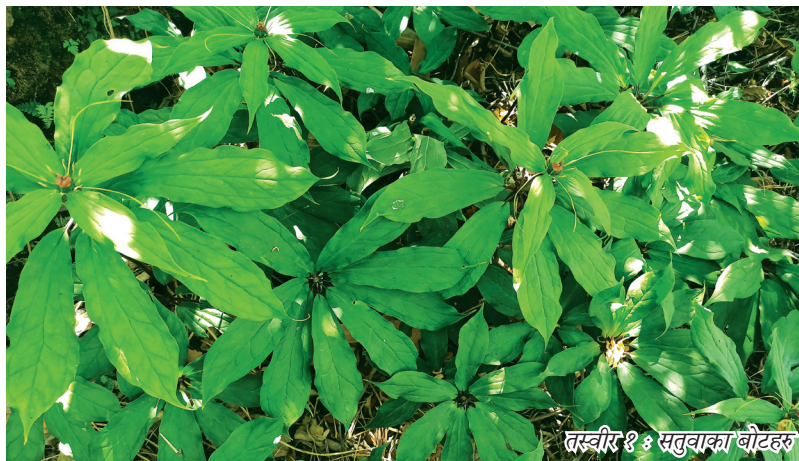
तस्वीर १: सुतुवाका बोटहरु

सुतुवा एउटा परम्परागत रूपमा प्रयोग गरिने बहुमुल्य बहुवर्षिय जडिबुटी हो । यसको वैज्ञानिक नाम- पेरिस पोलिफाइला (Paris polyphylla) हो । स्थानीय रूपमा यसलाई फरक फरक नामले चिनिन्छ जस्तै सत्वा, धुम्बामेन्दो (शेर्पा), नाताधाय (तामाङ) आदि । संस्कृतमा यसलाई हैमवतीवाचा भनिन्छ । यसको काण्ड (गानो)मा विभिन्न किसिमका औषधीजन्य रासायनिक तत्वहरु पाइने हुनाले यसलाई बहुउपयोगी जडिबुटीको रूपमा चिनिन्छ । ३० देखि ६० से.मी. अग्लो हुने यो वनस्पतिको गानो जडिबुटीको रूपमा उपयोग गरिन्छ । गानो समतल (Horizontal) भएर जमिनमुनि फैलिएको बाहिरी भाग खैरो र भित्री भाग सेतो र हल्का पहेलो रङको खण्ड-खण्ड परेको हुन्छ । गानोका खण्डहरुले कतिबर्ष पुरानो हो भन्न सकिन्छ । काण्डका गाँठाहरुबाट फागुन र चैत महिनामा टुसाहरु पलाउँछन् । गानो १७ से.मी. सम्म लामो र ४ से.मी. सम्म मोटो हुनसक्दछ । सुतुवाको डाँठ सिधा र हाँगा नभएको हुन्छ । कमलो डाँठ सेतो र छिपिए पछि हरियो प्याजी रङको हुन्छ । गुचुमुचु परेका (एउटै आँखलाबाट पलाएका) पातहरु डाँठबाटै पलाएका हुन्छन् र अण्डाकृत आकारका हुन्छन् । पातहरुको घेराबाट फूलफुल्ने डाँठ सुरिलो भएर निस्कन्छ र माकुराको जालो जस्तो फूल फुल्दछ । फूलका तलीहरु हरियो र पहेलो रंगको हुन्छ । मौसम अनुसार चैतदेखि आषाढ सम्ममा फूल फुल्दछ र कार्तिक महिनामा फल पाकेर संकलनयोग्य हुन्छ ।