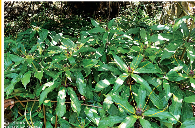
परिवर्तन ४ रोल्पाको भिउजी पाखा क.व. मा पाईएको सुतुवाका बोटहरु ।

विगतमा रोल्पाका २००० मिटर भन्दा उचाईमा रहेका प्राय सबै सेपिलो वन, खोलाखोल्सी र वारीकान्तामा पाइने यो बहुउपयोगी वनस्पति हाल लोपहुने अवस्थामा पुगेको छ । डिभिजन वन कार्यालय रोल्पाको विगत देखिका पञ्च वर्षिय योजनाहरुमा वार्षिक १००० के.जी. सम्म वनक्षेत्रबाट सुतुवाको जरा निकासी गर्न सकिने उल्लेख भएकोमा कार्यालयको रेकर्ड अनुसार आ.व. २०७०/०७१ देखि २०७८/०७९ सम्म कुल १७०१ के.जी. मात्र सुतुवाको जरा निकासी भएको पाइन्छ । वन कार्यालयले हालै गरेको अध्ययनमा रोल्पाका थवाङ र परिवर्तन गा.पा. का वन क्षेत्रहरुमा मात्र छुटपुट रूपमा सुतुवा पाइएको छ । निजी जग्गामा भने सुतुवा हराई सकेको छैन । खासगरी थवाङको उवा (वडा नं. ४ र ५) क्षेत्र, रोल्पा नगरपालिका वडा नं. १० को पेवा वल्लेदह र परिवर्तन गा.पा. को पाछावड